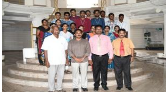
TCS selected students posing with senior functionaries of the college