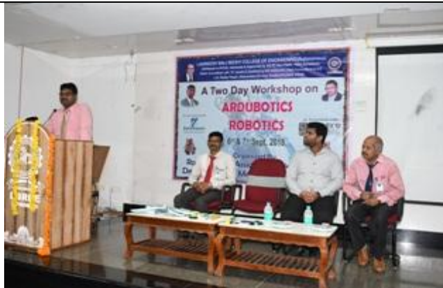
Principal delivering inaugural address @ Robotics workshop