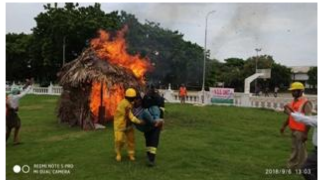
An action from the fire safety drill