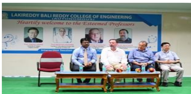
The visiting professors at the interactive session