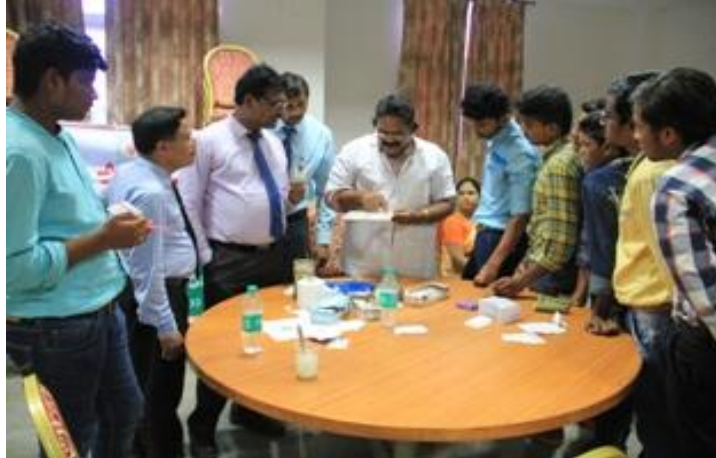
Principal inspecting the camp