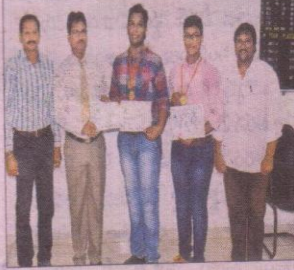
విద్యార్థులను అభినందిస్తున్న అధ్యాపకులు