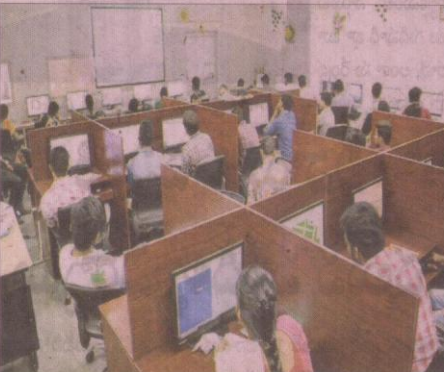
ముగింపు శిక్షణలో పాల్గొన్న విద్యార్థులు

మైలవరం, సెప్టెంబర్ 12: స్థానిక పర్వనా హాజరైన హైదరాబాద్ జీఐ ఎల్ఐఆర్సీఈలో జీఐఎస్ (జియోగ్రాఫిక్ ఇన్ ఫర్మేషన్ సిస్టమ్స్)పై రెండోజులుగా జరుగుతున్న సదస్సు బుధవారం ముగిసింది. సదస్సుకు రీసెర్చ్