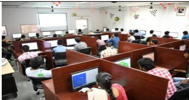
A view of the workshop in progress...