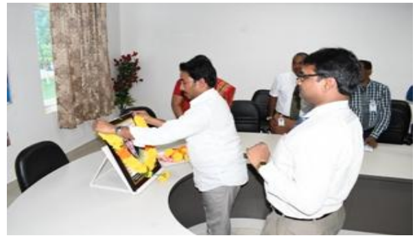
President paying floral tributes at Engineers Day function

The Civil Engineering Dept. & the college NSS unit celebrated Engineers Day in the campus on 15 th Sep'18. The president paid floral tributes to the portrait of Eminent Engineer and Nation builder, Sri.M.Visweswaraya in the presence of the principal, Vice principal, Deans, HoDs and faculty.