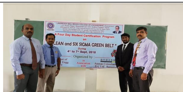
The trainer posing with HoD and other professors