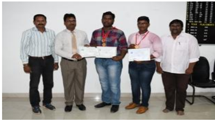
The sports achievers posing with the Principal, Physical Director & Trainer