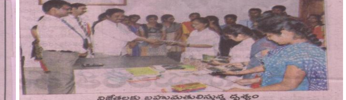
విజేతలకు బహుమతులిస్తున్న దృశ్యం