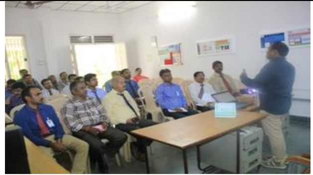
The workshop on 5G Technologies in progress...