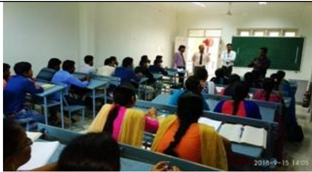
The seminar in action