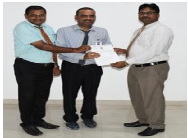
The awardee sharing joyful moments with principal & HOD