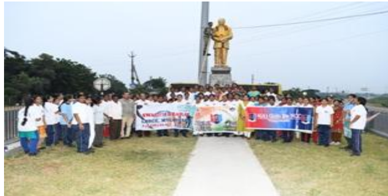
A snap from the NCC event