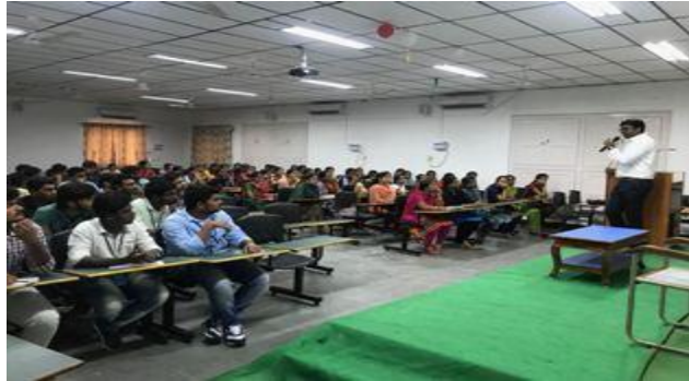
The seminar on FinTech Industry in progress...