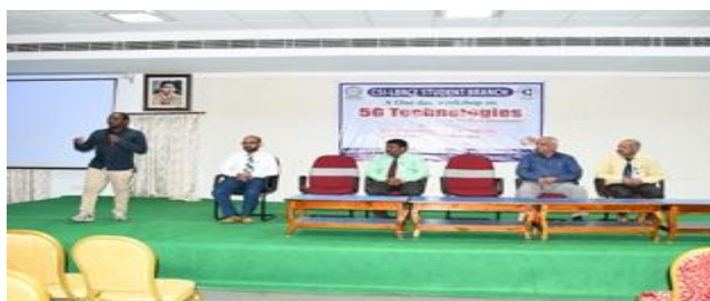
A still from inaugural of the workshop on 5G Technologies